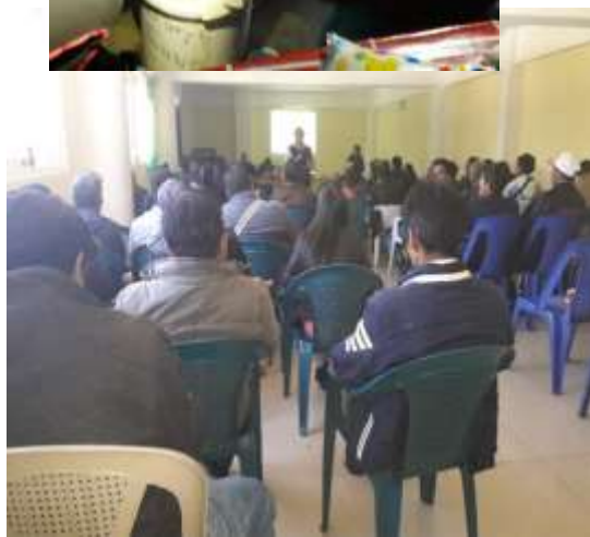
REUNIÓN DE COMUDE Y COMUSAN