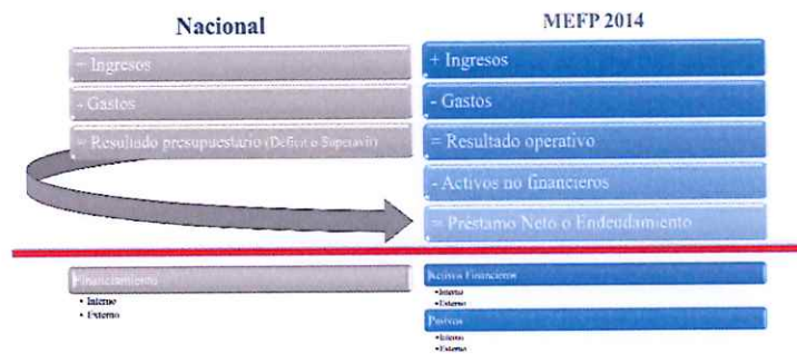
Diferencia conceptual Entre la metodología nacional y el MEFP2014 Gráfica 1

De esa cuenta algunos avances destacados en el fortalecimiento de las EFP: 1) Ejercicios de consolidación de la cuenta económica del sector público no financiero; 2) documento sobre avances en las EFP que siguen los estándares internacionales; y, 3) Publicación de las EFP según estándares internacionales.